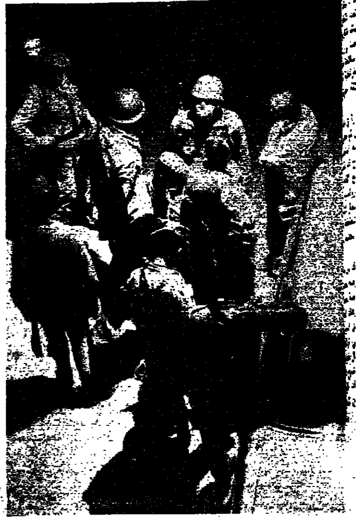
■ رجال أمن يستمعون الى بيانات وقف إطلاق النار من جهاز راوي سيارة